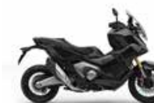
Graphite Black Nové