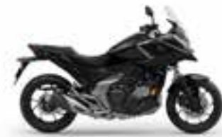
Eco Black R Nové