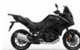
Gunmetal Black Metallic Nové