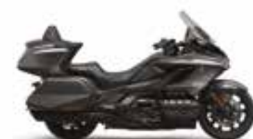
Heavy Gray Metallic-U