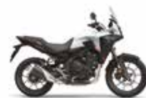
Pearl Horizon White