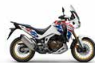
Pearl Glare White Nové