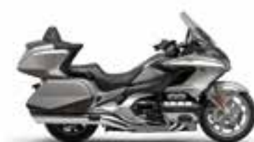
Beta Silver Metallic Iridium Gray Metallic