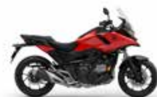
Fighting Red Nové