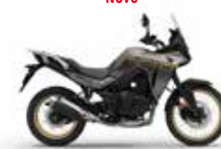
Pearl Deep Mud Gray Nové