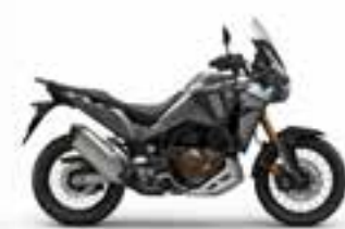
Mat Iridium Gray Metallic Nové