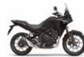
Mat Gunpowder Black Metallic