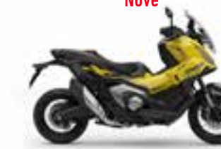
Mat Goldfinch Yellow Nové - Special Edition