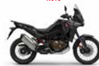
Mat Ballistic Black Metallic Nové