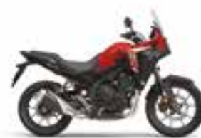
Grand Prix Red