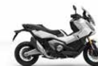
Pearl Glare White Nové