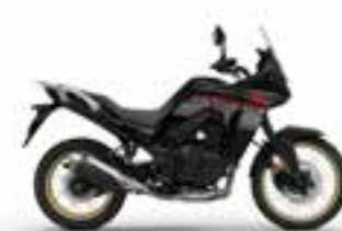
Graphite Black Nové