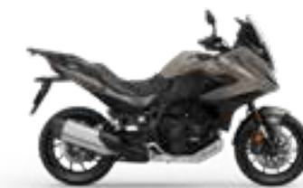
Mat Warm Ash Metallic Nové