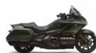
Mat Armored Green Metallic