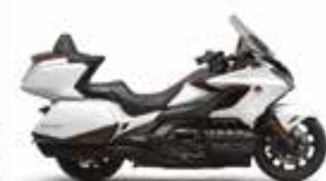
Pearl Glare White