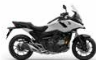
Mat Pearl Glare White Nové