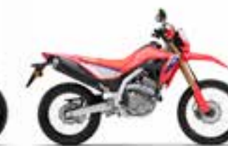
Extreme Red Nové