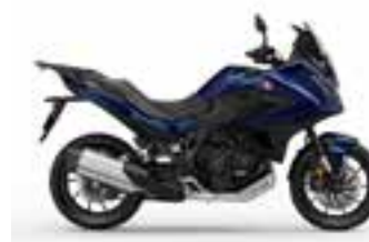
Pearl Hawkseye Blue Nové