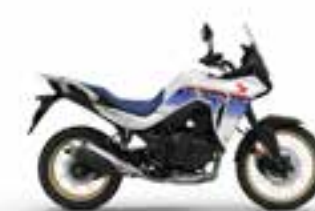
Ross White Nové