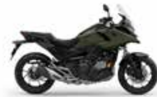
Eco Ivy Ash Green R Nové