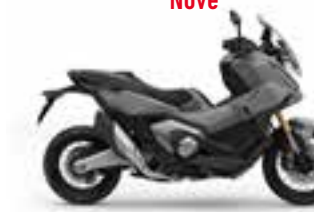
Mat Deep Mud Gray Nové