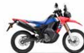
Extreme Red Nové