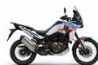
Pearl Glare White (ES Model Only) Nové