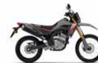
Swift Gray Nové