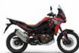
Grand Prix Red Nové