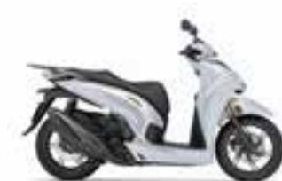
Pearl Nebbia White Nové