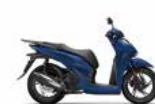
Mat Pearl Pacific Blue