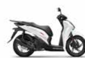
Mat Pearl Cool White Sport Edition