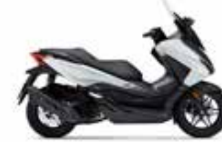
Mat Pearl Cool White Nové