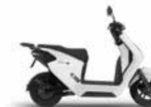
Pearl Sunbeam White