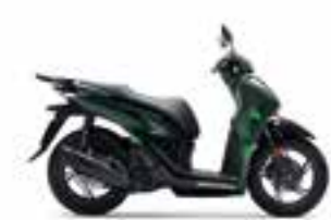
Vetro Green R