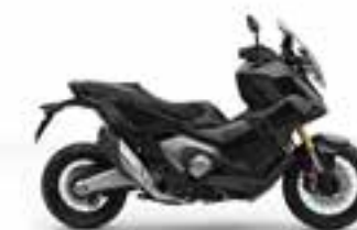
Graphite Black Nové