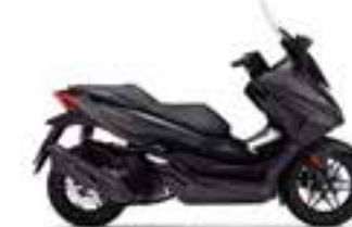
Mat Cynos Gray Metallic Nové