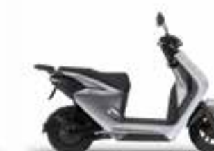
Digital Silver Metallic