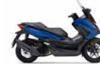
Mat Pearl Pacific Blue Nové