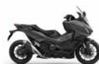
Iridium Gray Metallic Nové