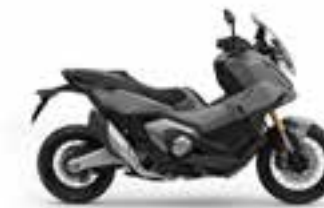
Mat Deep Mud Gray Nové