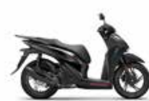
Mat Coat Black Metallic Sport Edition