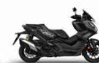
Mat Coal Black Metallic Nové - Special Edition