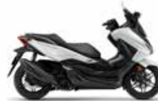
Mat Pearl Cool White Nové