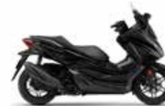
Pearl Nightstar Black Nové