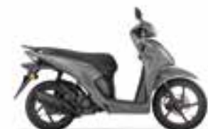
Pearl Jupiter Gray