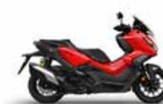
Hyper Red Nové