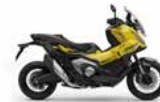
Mat Goldfinch Yellow Nové - Special Edition