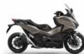
Mat Warm Ash Metallic Nové