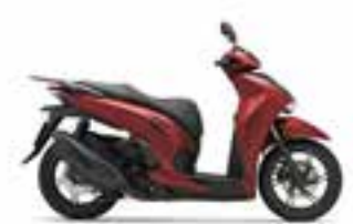
Mat Pearl Diaspro Red Nové · Special Edition