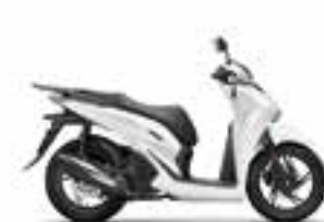
Mat Pearl Cool White