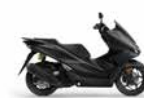
Mat Galaxy Black Metallic Nové