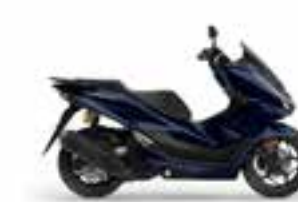
Pearl Darl Ash Blue 2 Nové