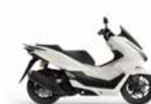
Pearl Snowflake White Nové