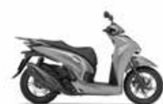
Mat Lucent Silver Metallic Nové