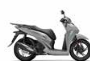
Pearl Falcon Gray