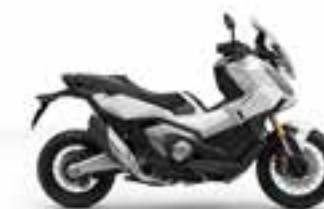
Pearl Glare White Nové