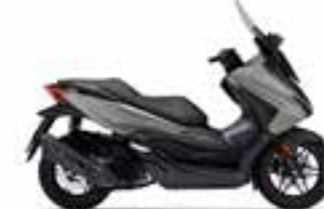
Pearl Falcon Gray Nové