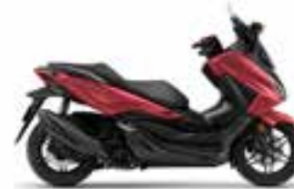
Carnelian Red Metallic Nové