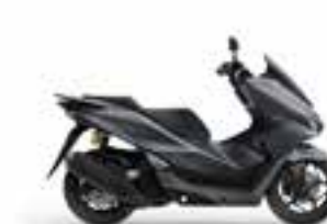
Mat Dim Gray Metallic Nové