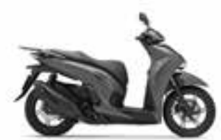
Mat Rock Gray Nové · Special Edition