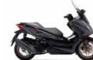
Mat Cynos Gray Metallic Nové - Special Edition