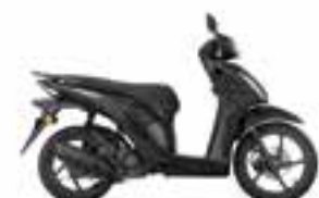
Mat Galaxy Black Metallic