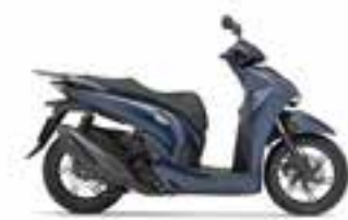
Mat Jeans Blue Metallic Nové