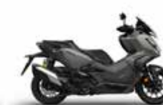
Mat Ruthenium Silver Metallic Nové