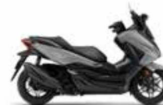
Pearl Falcon Gray Nové