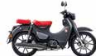
Mat Axis Grey Metallic