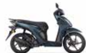
Mat Suit Blue Metallic