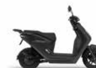
Mat Ballistic Black Metallic