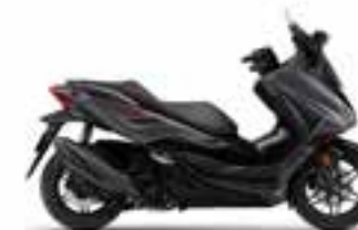
Mat Cynos Gray Metallic Nové - Special Edition