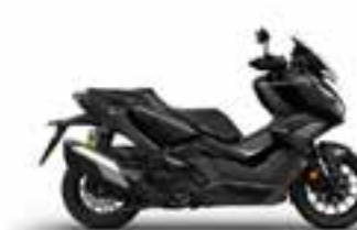
Pearl Nightstar Black Nové