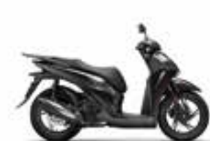
Pearl Nightstar Black