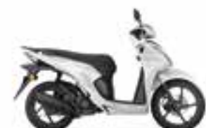
Pearl Jasmine White