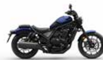
Pearl Hawkseye Blue Nové