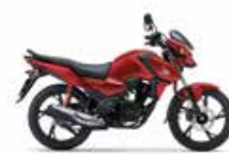
Imperial Red Metallic