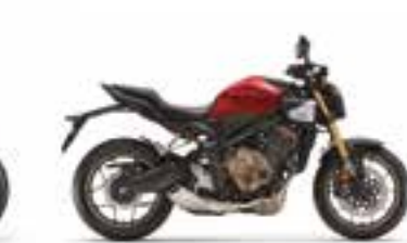
Candy Chromosphere Red