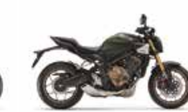
Mat Laurel Green Metallic