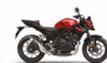
Grand Prix Red