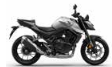
Digital Silver Metallic Nové