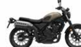
Mat Fresco Brown Nové