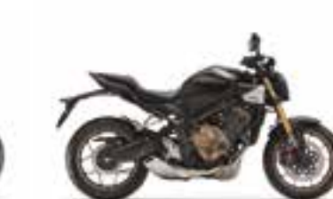
Mat Gunpowder Black Metallic