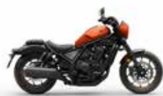
Flare Orange Metallic Nové · Special Edition