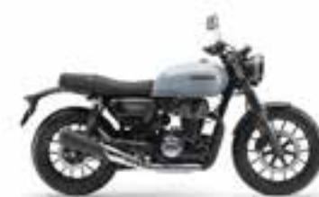
Pucó Blue Nové