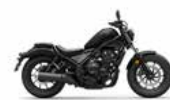
Mat Gunpowder Black Metallic Nové