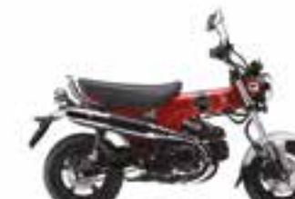
Pearl Nebula Red