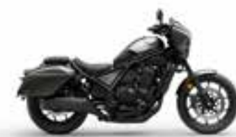
Iridium Grey Metallic Nové