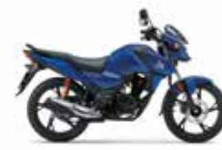
Mat Marvel Blue Metallic