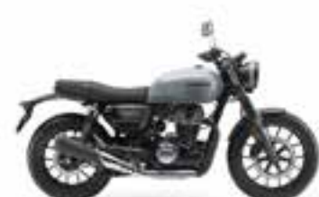
Pearl Deep Mud Gray Nové