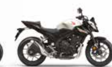
Pearl Himalayas White