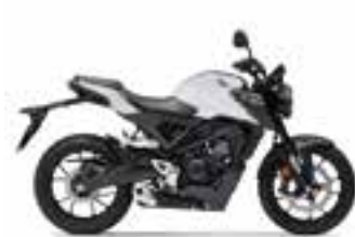
Pearl Cool White