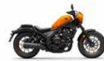
Candy Energy Orange Nové · Special Edition