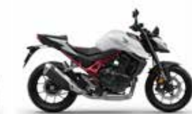
Mat Pearl Glare White Nové