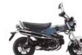
Pearl Cadet Gray