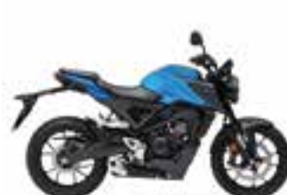
Reef Sea Blue Metallic