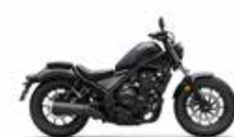
Mat Dim Gray Metallic Nové