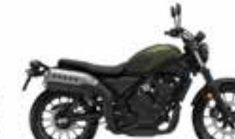
Mat Laurel Green Metallic