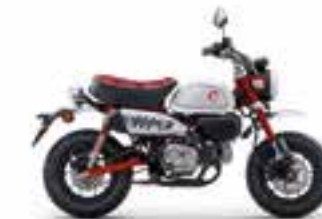
Pearl Nebula Red