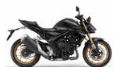
Mat Ballistic Black Metallic Nové