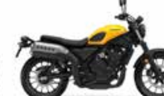
Pearl Dusk Yellow Nové