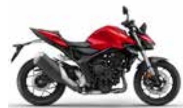
Grand Prix Red Nové