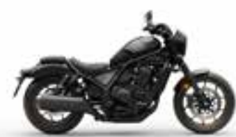
Matte Ballistic Black Metallic Nové · Special Edition