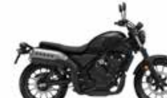
Mat Gunpowder Black Metallic