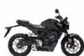
Mat Cynos Gray Metallic