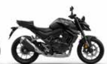
Mat Ballistic Black Metallic Nové