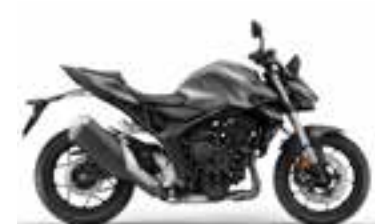
Mat Iridium Gray Metallic Nové