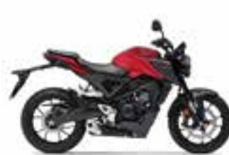
Pearl Splendor Red