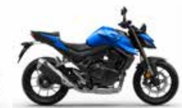
Glint Wave Blue Metallic Nové