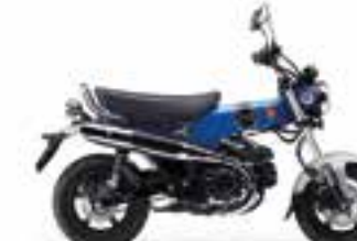
Pearl Glittering Blue