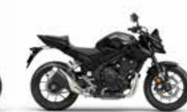
Mat Gunpowder Black Metallic