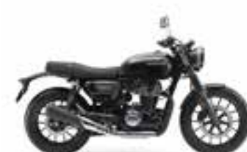
Gunmetal Black Metallic Nové