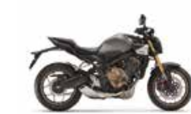
Pearl Smoky Gray