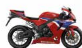
Grand Prix Red