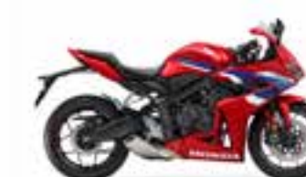
Grand Prix Red