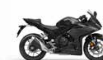
Mat Gunpowder Black Metallic