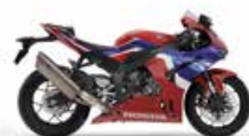
Grand Prix Red