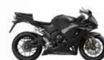
Mat Ballistic Black Metallic