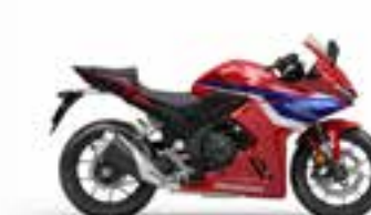
Grand Prix Red