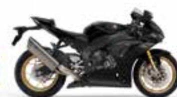
Mat Pearl Morion Black Carbon Edition