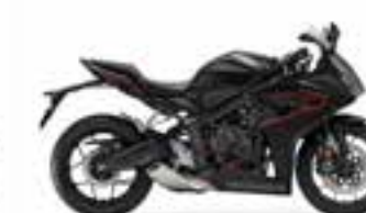
Mat Gunpowder Black Metallic