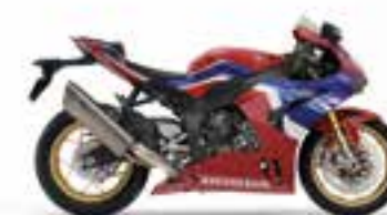
Grand Prix Red